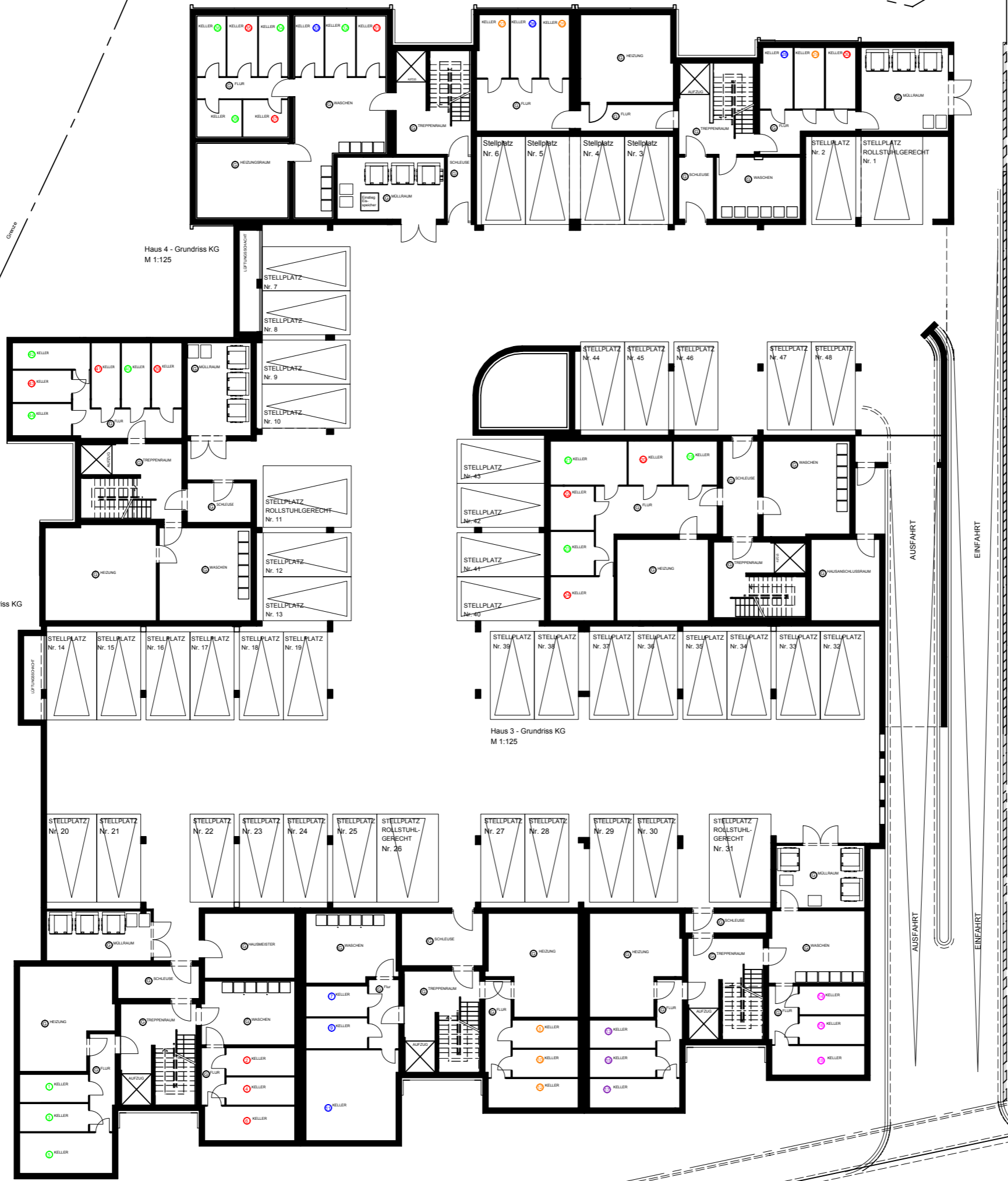
Haus 1 - Grundriss KG M 1:125